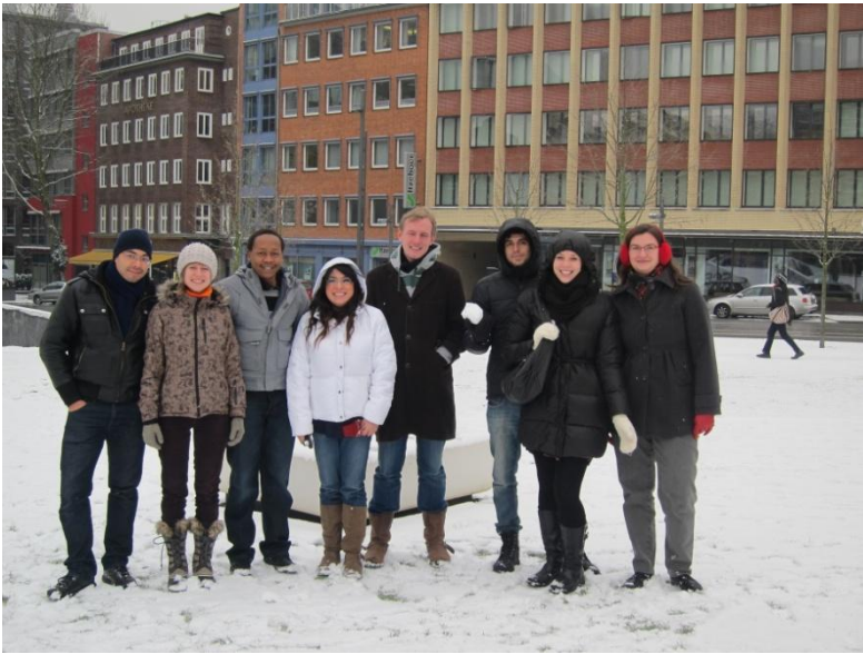
Bab.la i sneen!